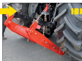
Levage du châssis. Puis accrochage des chaînes au point haut du tracteur avec mise en tension maximale