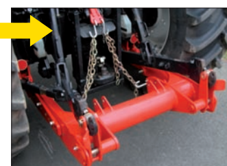
Baisse du relevage. Le STABI-LINK® pivote autour des chaînes. Les crochets du châssis s'engagent dans les chapes du tracteur

Le STABI-LINK® et le relevage du tracteur sont opérationnels. L'attelage à la faucheuse débroussailleuse peut s'effectuer. Le tracteur et la faucheuse débroussailleuse ne font plus qu'un.