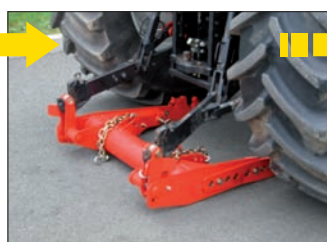
Attelage sur les oreilles arrière du STABI-LINK® avec les bras de relevage du tracteur