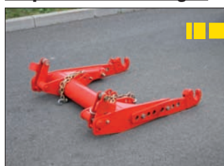
Réglages préalables du STABI-LINK® avant l'attelage (longueur des bras)